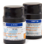
CAL Check 核查标定组