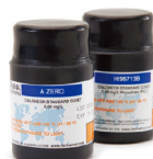
CAL Check 核查标定组