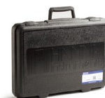
HI721006 HI96 系列专用便携箱