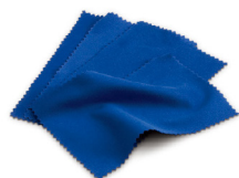
HI731318 比色皿专用清洁布