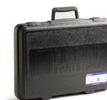
HI721006 HI96 系列专用便携箱