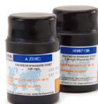
CAL Check 核查标定组