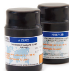
CAL Check 核查标定组