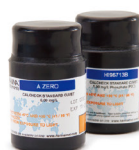
CAL Check 核查标定组