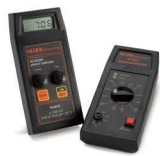
HI8427/HI931001 pH/ORP 模拟器